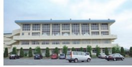
創立35年の歴史ある陽明小学校。緑豊かな環境の中で勉強できる