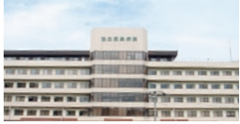
平野駅前の協立温泉病院。診療科目は内科、外科、消化器科ほか