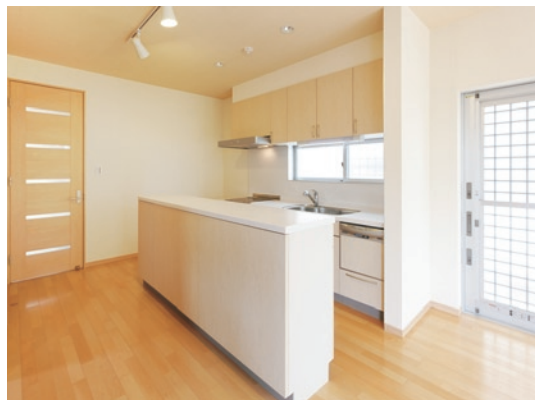
リビングの吹き抜けから差し込む光でキッチンも明るい。手前には和室があるから、家事の間は小さい子供をそこで寝かしたり遊ばせると目が届いて安心