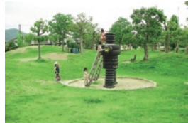
徒歩2分の奥池公園には遊具が揃う。広いから散歩中の犬も楽しそう