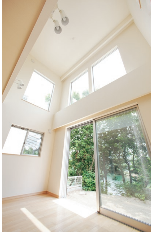
リビングの大きな窓を開けると、緑まぶしい木々。その向こうには大きな「奥池」が広がる。高い吹き抜けの2階からも、緑豊かな景色が堪能できる