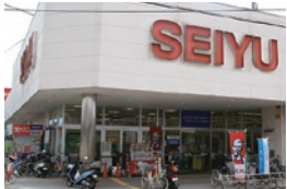
西友は24時間営業(一部ゾーン除く)なので使い勝手が良いそうだ