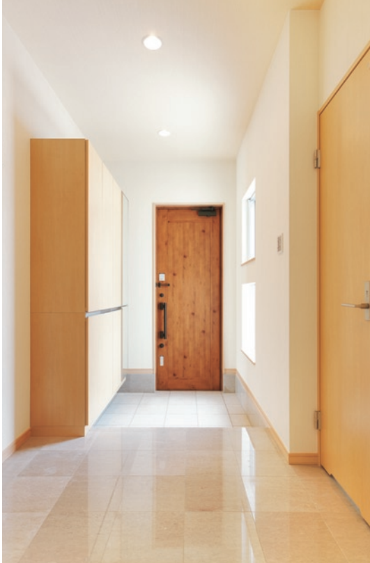
ゲストをお迎えする玄関ホールは、窓から自然の光が射しこみ明るい空間に。ソファのあるフロアが華やかな雰囲気演出。扉の重厚感もいい