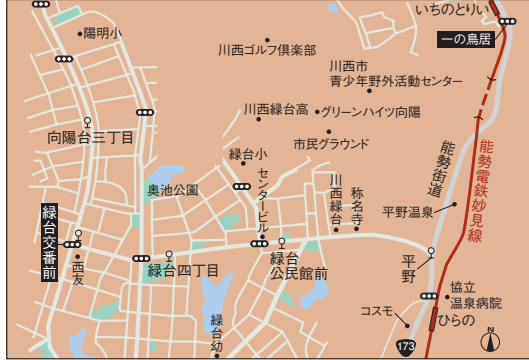
能勢電鉄平野駅から徒歩圏。途中には様々な店が軒を連ねる商店街(約690m)も。緑台四丁目バス停(約450m)も近いから疲れた時はバスを利用